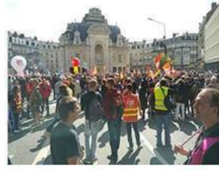
Lycées professionnels Lille