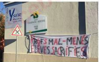
Lycée Yser Reims