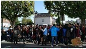
Lycée Mozart Blanc Mesnil