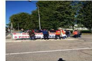
Albea Le Tréport en grève

luttés au quotidien : voir entre autres la page facebook