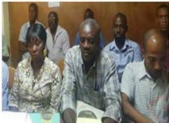
Port au Prince menace d'une grève générale dans les hôpitaux public