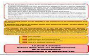
Manufacture Roche sur Yon