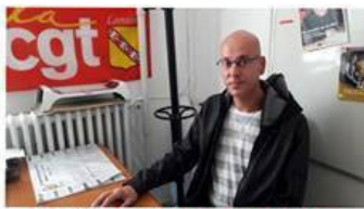
3 hopitaux en Grève dans les Vosges cinq vallées, de Saint-Dié et de Gérardmer.