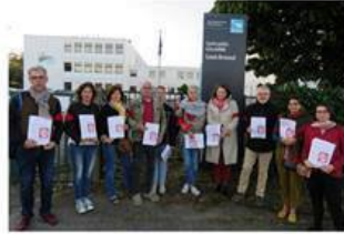
lycée professionnel Louis Armand de Locminé