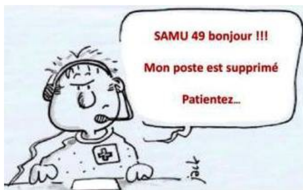
ASSISTANT DE REGULATION MEDICALE

https://www.youtube.com/watch?v=3CJkf7eel4g&feature=share