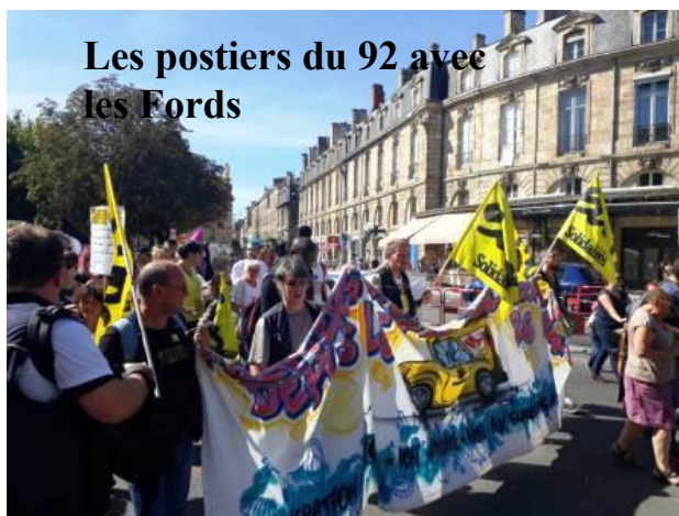
Les postiers du 92 avec les Fords

https://www.facebook.com/sudposte.hautsdeiseine/videos/530514900721262/