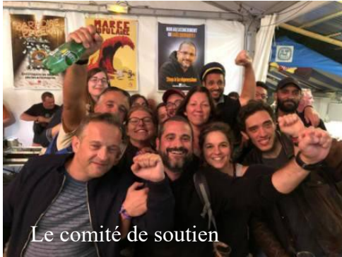
Le comité de soutien

marchandisant leur aide aux anciens, la distribution du pain, l'apprentissage de l'ordi, l'auto-école... Ils vendent des tranches d'humanité.