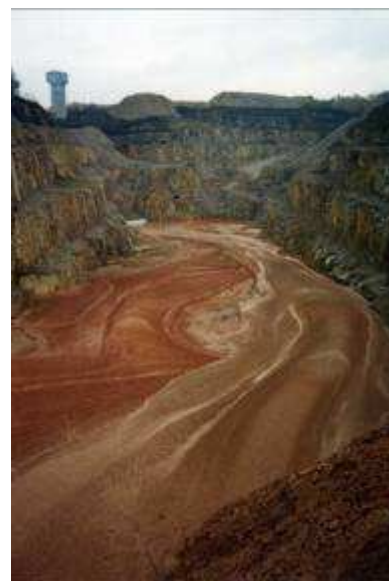
12 et 13 Déversement de résidus de l'usine SIMO de Bessines dans la carrière COGEMA de Bellezane en Limousin

La banalisation de ces résidus était telle en France que des personnes en ont utilisé pour faire le ciment de la dalle de leur cuisine, se retrouvant avec de très forts niveaux de radon dans la maison. A Bessines-sur-Gartempe (Limousin), les résidus étaient transportés par camions non bâchés et tombaient sur la chaussée devant les habitations. En 2005, la CRIIRAD a démontré que des résidus sont encore présents dans les fossés au bord de certains sites.