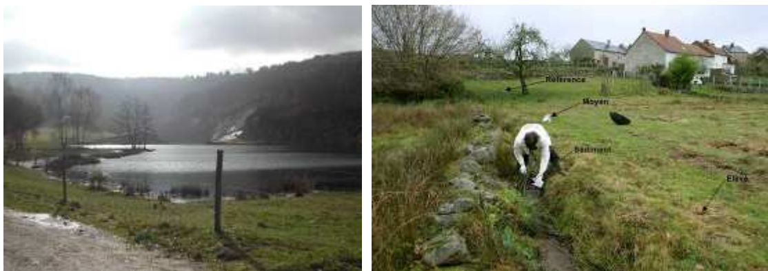
8 et 9 MCO de Puy de l'Age réaménagée et contamination de la prairie en aval.

En 2003 et 2004, pourtant, la CRIIRAD a pu vérifier à nouveau que les sédiments du ruisseau en aval de la mine de Puy de l'Age et les terres des berges des prairies en aval restaient contaminés (plus de 10 000 Bq/kg pour l'uranium 238 et plus de 30 000 Bq/kg pour le radium 226). Ce degré de contamination dépasse pourtant largement (parfois d'un facteur supérieur à 10) les seuils définis par la Direction Générale de la Santé pour la décontamination des terrains pollués... et la COGEMA refuse de racheter les terrains à leurs propriétaires ( voir photographies 8 et 9 ).