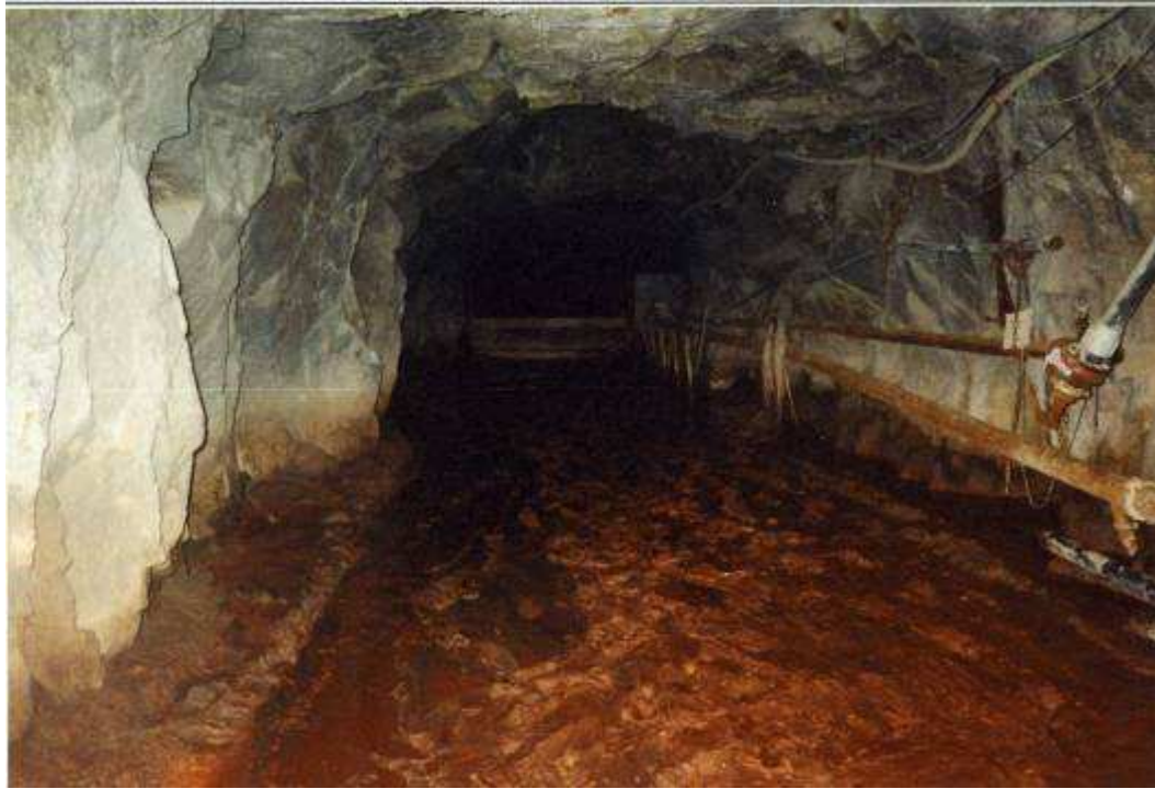
14 Accumulation de résidus dans une galerie sous le stockage de résidus de COGEMA à Bellezane (CRIIRAD, 1993).

On peut s'interroger également sur la faisabilité de l'entretien et de la surveillance à très long terme des stockages de type digue comme à Saint-Priest-La Prugne dans la Loire où 1 300 000 tonnes de résidus sont retenus, dans un bassin en eau de 18 hectares, par une digue en terre de 400 mètres de long.