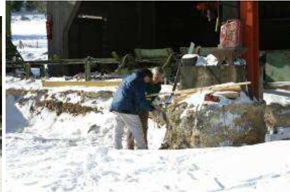
2 et 3 Scierie en cours de décontamination près du site des Bois Noirs (janvier 2004)

De nombreux autres sites sont concernés, bien qu'à un niveau de risque nettement inférieur. Lors de la réunion de présentation des résultats en préfecture de Roanne, le 7 octobre 2003, la CRIIRAD a insisté auprès des autorités pour que les remblais radioactifs présents dans l'environnement accessible au public, et en priorité lorsqu'ils sont à proximité des lieux d'habitation, soient également retirés. Dans certains cas, il serait justifié de retirer rapidement les blocs de minerai les plus actifs. Cette démarche a conduit les pouvoirs publics à distribuer un questionnaire aux habitants des communes proches du site des Bois Noirs, en 2004, afin de déterminer s'ils ont pu utiliser des remblais miniers ou collectionner des minéraux issus de la mine. C'est une première en France.