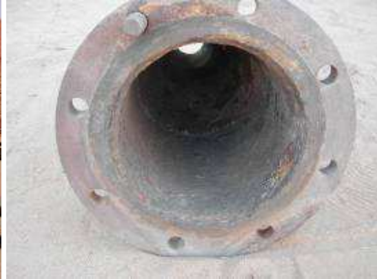
10 et 11 la CRIIRAD (B Chareyron) détecte la présence de ferrailles contaminées sur le marché à Arlit, Niger en décembre 2003. Photo de droite : un fragment de tartre est prélevé sur la tuyauterie contaminée

L'association Collectif des Bois Noirs et la CRIIRAD ont exigé qu'aucun matériau de démantèlement de l'usine ne soit recyclé, ce que la COGEMA a finalement accepté.