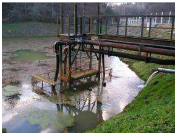
6 Bassin de décantation des eaux d'exhaure de la mine COGEMA de Puy de l'Age en Limousin (CRIIRAD, 1993)