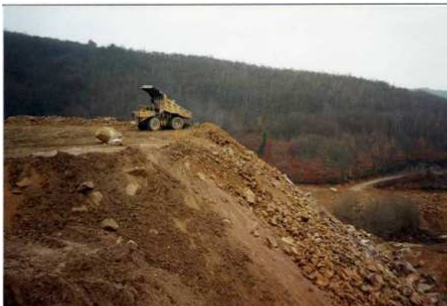
1 Verse à Stériles de Puy de l'Age (CRIIRAD, 1993)

Dans tous ces cas, les matériaux radioactifs étant à la surface du sol, il n'y a plus de protection par la terre. Le niveau de radiation à 1 mètre du sol est alors nettement plus élevé que celui du terrain naturel. La dose de radiation subie par les habitants dépend bien entendu de la surface de terrain remblayée par les stériles, du degré de radioactivité des stériles (concentration en uranium) et du temps passé sur ces terrains. Il est certain que ces doses ne sont pas négligeables sur le plan sanitaire (au sens de la directive Euratom de mai 1996) et pourraient très probablement conduire certains habitants à des niveaux de risque inacceptables.